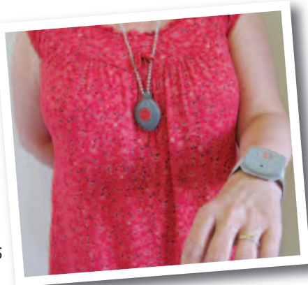
Collier et montre connectés à la téléassistance

Les interventions liées à l'accompagnement permettent le maintien d'une vie sociale et par des échanges et des activités, de rompre l'isolement.