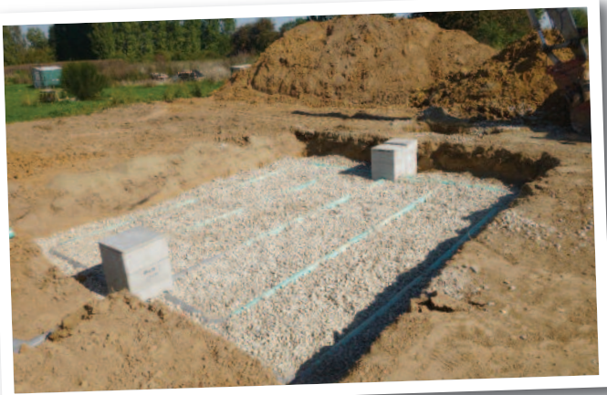
Installation d'un assainissement non collectif

Depuis le 1 er janvier 2017, le territoire de la CCGR regroupe environ 5 000 installations d'assainissement non collectif sur les 62 communes adhérentes.