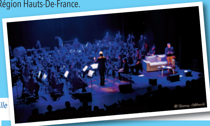
Lettres en bataille

• Nabucco : 231 personnes ont pu assister à la retransmission de l'opéra de Verdi au Théâtre de l'Avre en partenariat avec la Région Hauts-De-France.