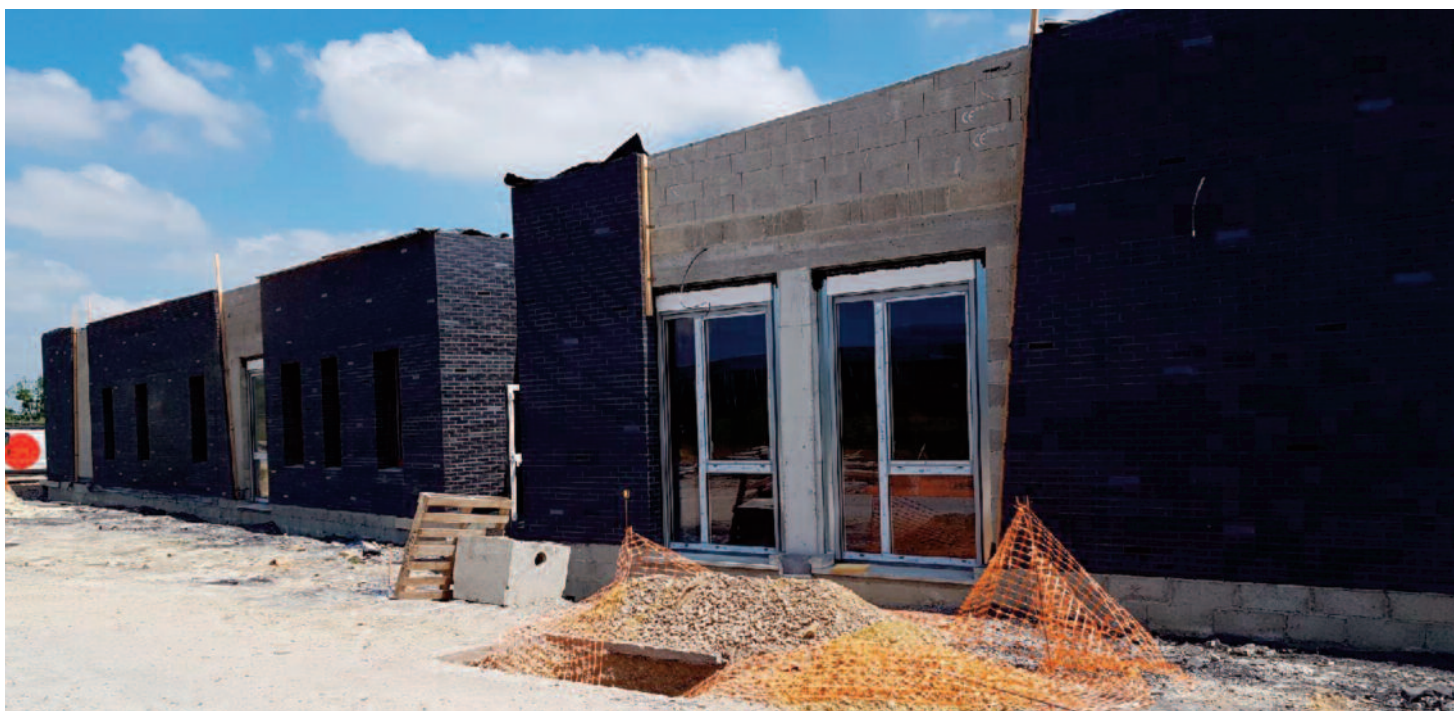
Avancement des travaux de la future Maison de Santé Pluridisciplinaire