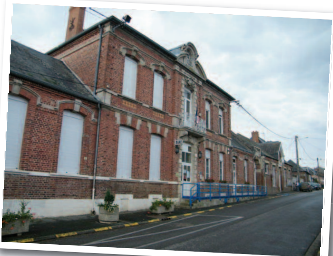
La création d'un pôle d'accueil et de services à Ercheu.

La Communauté de Communes du Grand Roye a signé avec l'Etat le 10 juillet 2017 un contrat de ruralité, qui répond à une logique de projet de territoire avec la mise en place d'actions autour de 6 volets: