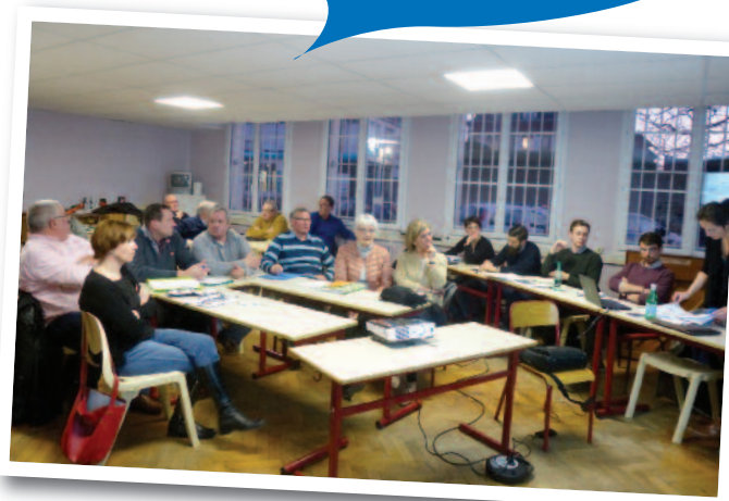
Réunion PLUi avec le cabinet d'étude "Ville Ouverte" et notre Assistant à maîtrise d'ouvrage "Quartier Libre".

La Communauté de Communes du Grand Roye est entrée dans la phase Projet d'Aménagement et de Développement durable (PADD) depuis mars. Les élus travaillent sur la définition des grandes orientations en matière d'urbanisme pour les 15-20 ans à venir. Pour cela, tous les représentants communaux PLUi se réunissent régulièrement lors des réunions de secteurs et les référents de secteurs ou rapporteurs, lors des comités de suivi.