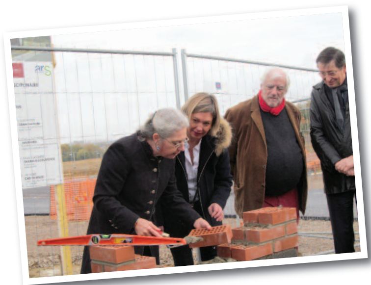
Pose de la première pierre de la Maison de Santé Pluridisciplinaire le 16 novembre 2017.

Toute une équipe composée de médecins généralistes, infirmiers, sages-femmes, kinésithérapeutes, psychologues, ophtalmologues, pédicures-podologues et orthoptistes sera prête à vous accueillir.